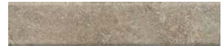
26314 Брюссель микс матовый 6x28,5