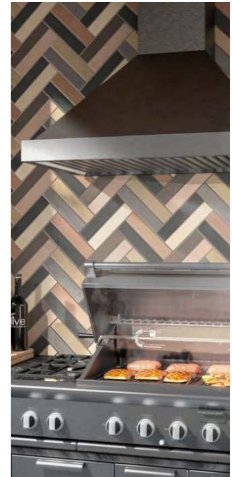
Амстердам | 6x28,5