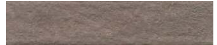
26310 Марракеш коричневый светлый матовый 6x28,5