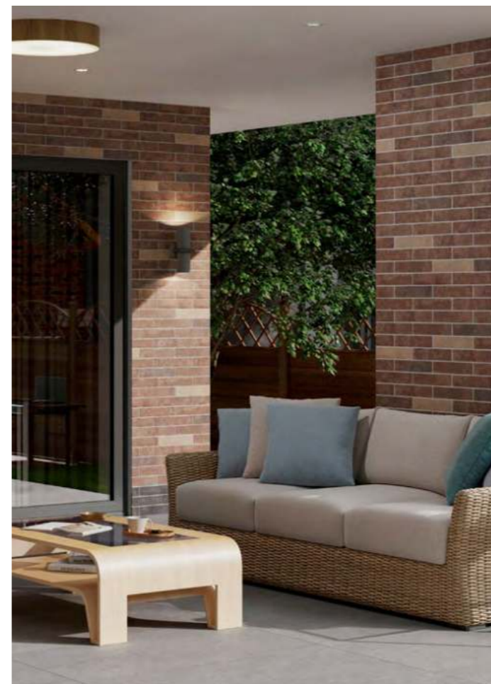
Марракеш | 6x28,5