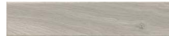
26317 Вудсток бежевый светлый матовый 6×28,5