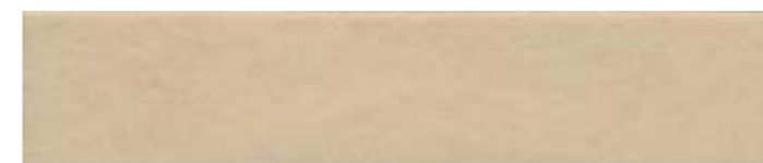
26300 Амстердам бежевый матовый 6x28,5