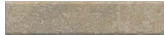
26313 Брюссель бежевый матовый 6x28,5