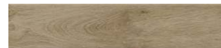
26325 Вудсток бежевый тёмный матовый 6×28,5