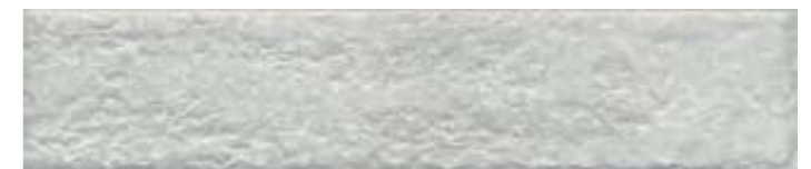
26324 Марракеш серый светлый матовый 6x28,5