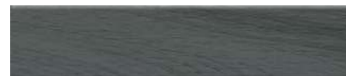
26322 Вудсток серый тёмный матовый 6×28,5