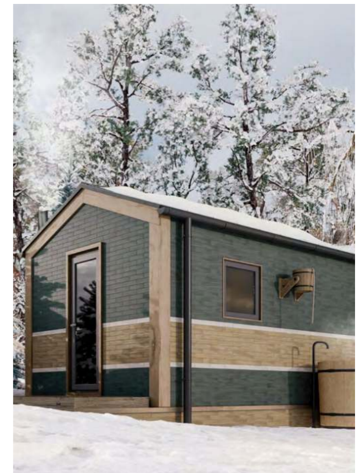
Вудсток | 6x28,5