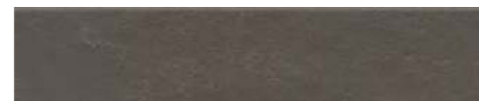
26305 Амстердам коричневый матовый 6x28,5