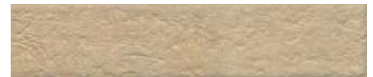
26308 Марракеш бежевый матовый 6x28,5