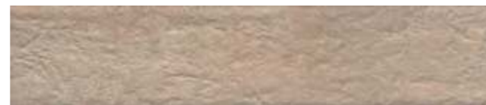
26307 Марракеш бежевый светлый матовый 6x28,5