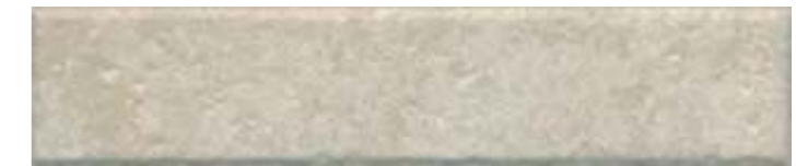
26312 Брюссель бежевый светлый матовый 6x28,5