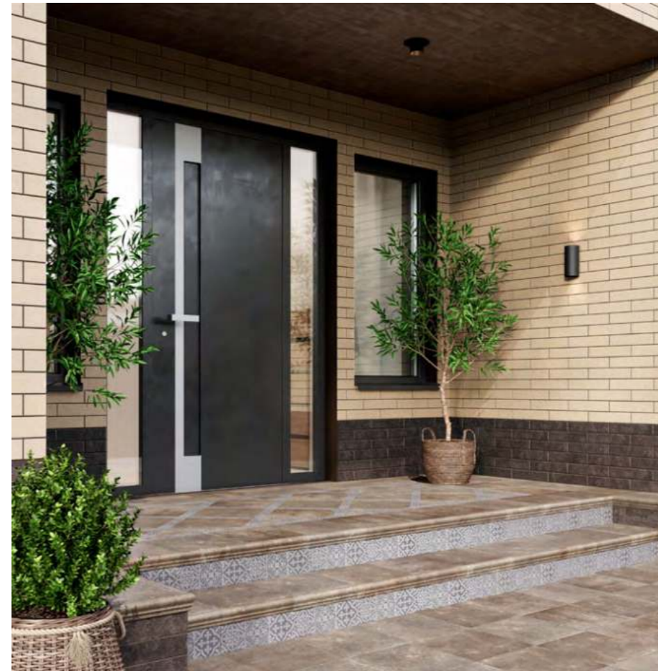
Брюссель/Марракеш | 6x28,5

Фасадная керамическая плитка устойчива к осадкам и загрязнениям, на ней не образуются высолы. Придать отделке идеальную чистоту можно с помощью простой воды, без агрессивных чистящих средств.