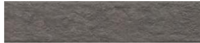
26311 Марракеш коричневый матовый 6x28,5